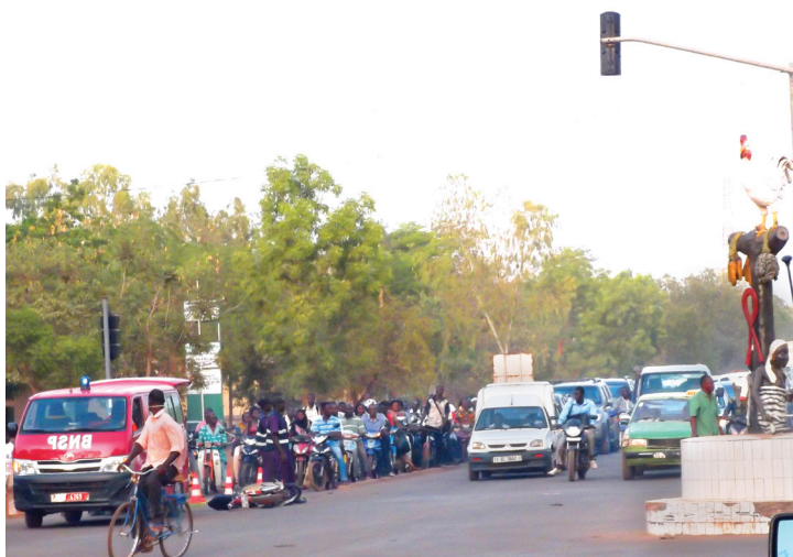
Intervention de la BNSP lors d'un accident - croisement de l'avenue Charles de Gaulle et l'avenue du Burkina

Une recherche exploratoire a été réalisée dans l'arrondissement de Baskuy en 2012. Elle avait pour but de cartographier les lieux où se produisent les accidents, aussi appelés points noirs de l'accidentologie , à partir des bases de données de l'ensemble des acteurs de la sécurité urbaine. Ces points noirs sont les lieux où se produisent un nombre important d'accidents de la circulation. La finalité de cette recherche était de vérifier s'il était possible de produire une cartographie à partir des procès-verbaux établis par les forces de l'ordre et les sapeurs-pompiers. Ce type de cartographie a pour intérêt de cibler les lieux où se produisent les accidents afin de réaliser des aménagements pour tenter de les réduire.