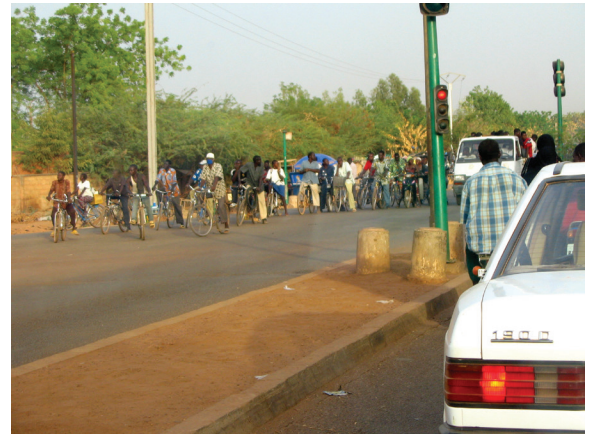
Circulation sur la route de Ouahigouya

Ces éléments sont en voie d'être pris en compte, à la fois par les actions menées par l'ONASER ou l'OSCO, mais aussi par des projets de recherches sur le territoire burkinabè. L'Institut de Recherche pour le Développement, l'Université de Montréal (CRCHUM) et l'INSS vont mener entre 2014 et 2016 une recherche sur les traumatismes issus de la circulation routière . Elle permettra de pérenniser les bases cartographiques et de développer un outil de surveillance. Plus globalement, les finalités de cette recherche sont d'étudier et de proposer des solutions d'harmonisation des bases de données sanitaires sur la question des risques routiers, de géolocaliser en temps réel les accidents, d'analyser le comportement des populations sur la voie publique et enfin d'estimer le coût des accidents de la route et la prise en charge pour les victimes.