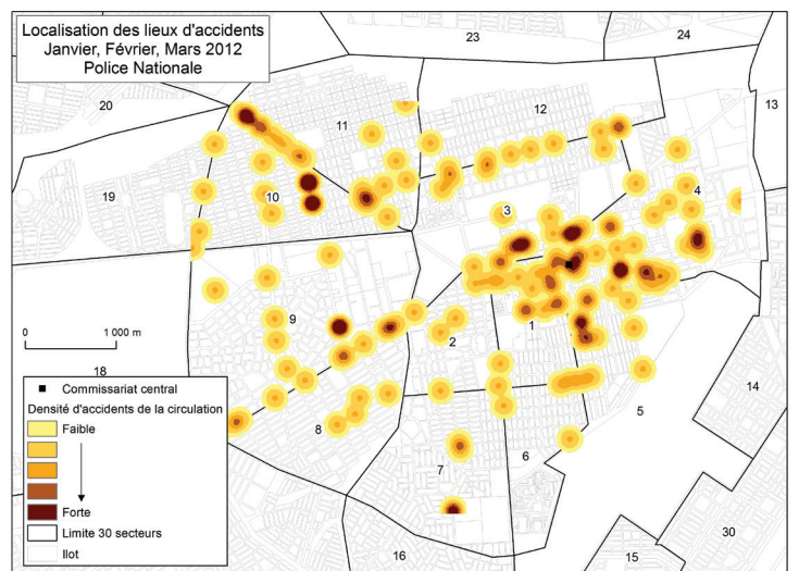
Carte n°3 : Localisation des lieux d'accidents en janvier/ février/mars 2012 Source : IGB, données avp Police nationale - Réalisation : A. Nikiéma, INSS/CNRST, E. Bonnet, IRD Ouagadougou/Université de Caen

Le constat est évident, certains réseaux de transport concentrent les accidents. Ceci renforce le besoin de produire des cartes de points noirs régulièrement pour mener des opérations d'aménagement, de sensibilisation, de régulation de circulation ou de prévention.