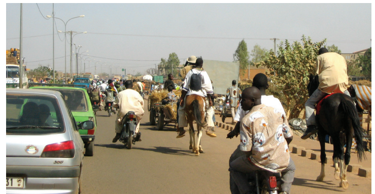
Diversité des modes de transport et cohabitation sur la voie publique

Les données (condition(s) d'accident, type, informations sur les victimes) des mois de décembre 2007, 2009 et 2012 issues des procès-verbaux de la BNSP ont été saisies et cartographiées. D'autres données issues des relevés de la Police nationale et de la Gendarmerie nationale (2012) ont aussi été saisies et cartographiées.