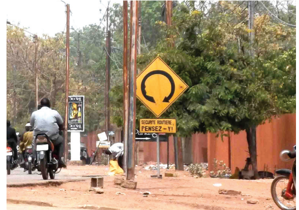
Panneau de prévention de la sécurité routière