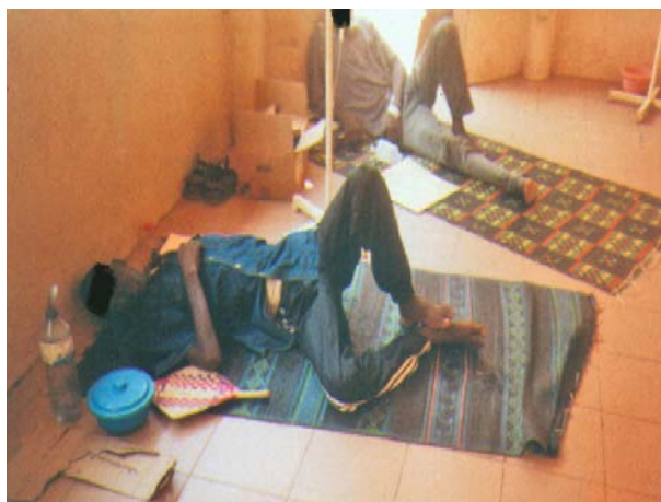
Figure 4 : Le manque de matériel et de personnel est problématique pour les conditions de prise en charge dans le service des urgences traumatologiques du CHU-YO.