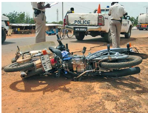
Figure 3 : Les deux-roues sont impliqués dans 70% des accidents. Sans casque, le risque de traumatisme crânien est important.

Le rôle de l'accompagnant va orienter le processus de prise en charge de son malade. Sa connaissance des locaux, son habileté à obtenir les kits d'urgence ou les médicaments rapidement, son aptitude à établir des liens avec les personnels et sa capacité financière peuvent réduire ou au contraire augmenter le délai de délivrance des soins [7][9]. La position sociale et l'appartenance « ethnique » de l'accompagnant va jouer un rôle primordial dans la façon dont va se dérouler le séjour du patient. Tout en humanisant les soins, CHL permet de réduire les inégalités de traitement des individus abandonnés sans regard pour l'âge, le sexe ou l'appartenance sociale.